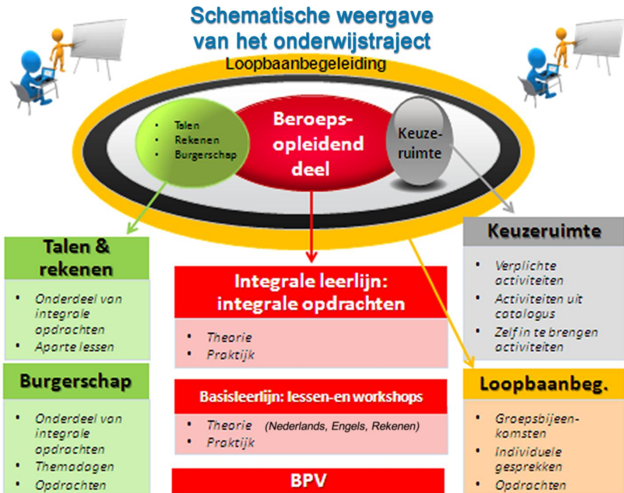
Figuur 1: schematische weergave van het onderwijstraject.

Elk schooljaar heeft vier perioden. Een periode bestaat uit 10 effectieve lesweken en duurt dus langer als hier een vakantie in valt.